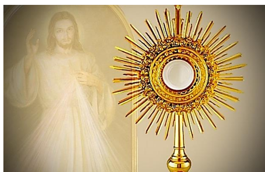
Kliknij obraz powyżej

Święto Miłosierdzia Bożego obchodzone jest w pierwszą niedzielę po Wielkanocy, zwaną obecnie Niedzielą Miłosierdzia Bożego. Święto to, choć jest jednym z najmłodszych w kalendarzu liturgicznym, ukazuje jedną z najważniejszych prawd chrześcijaństwa. Można powiedzieć, że zostało ustanowione na prośbę samego Jezusa, przekazaną w objawieniach siostrze Faustynie Kowalskiej – obecnie świętej Faustynie.